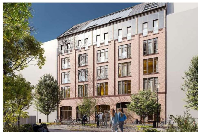
Så här förväntas huset se ut från gatan. Det blir 22 meter brett och fem våningar högt. Foto: Omniplan

– Vi har inte så mycket pengar att vi kan bygga det själva.